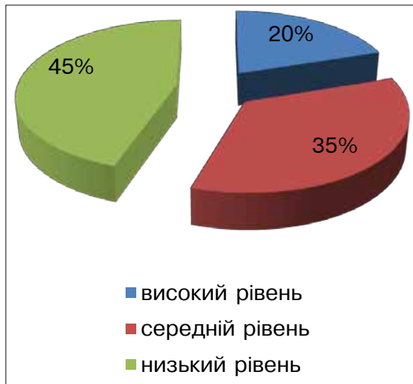
Рис. 2. Розподіл показника швидкості у студентів за методикою Е. Торренса

сійного становлення майбутніх психологів у системі ЗВО необхідний.