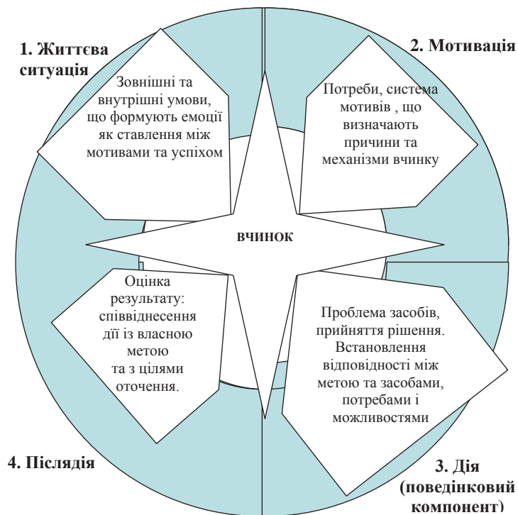
Рис. 2. Структура вчинку (за В.А. Роменцем)

У зв'язку з провідним інтимно-особистісним спілкуванням студента у групі ровесників його активність у поведінковій сфері спрямовується на здійснення впливу на оточення,