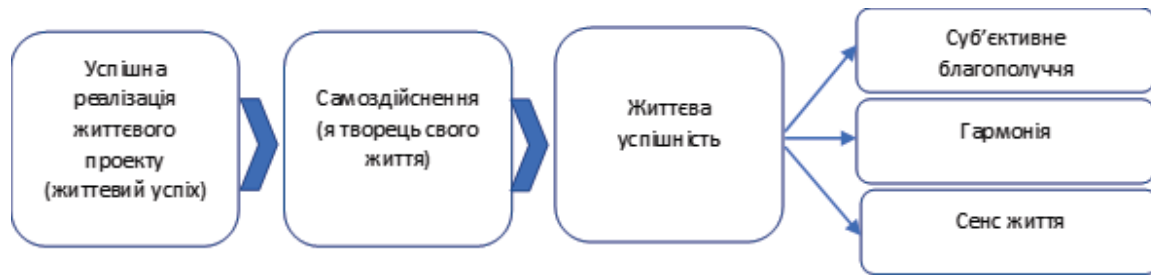
Рис. 4. Компоненти життєвої успішності

думах про це і уявити людину, яка перебуває у процесі реалізації власного життєвого проекту, що проходить успішно, то можна говорити про самоздійснення – процес, у якому особа відчуває себе творцем власного життя. Якщо життєтворення ефективно і результативно, задовольняє усі важливі сфери життя, то людина відчуває гармонію, благополуччя і розуміє, що її життя має сенс.