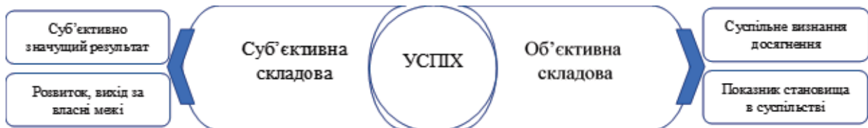
Рис. 1. Компоненти успіху

На думку Є.П. Белінської, «щастя, успішність, благополуччя, задоволення, комфорт –