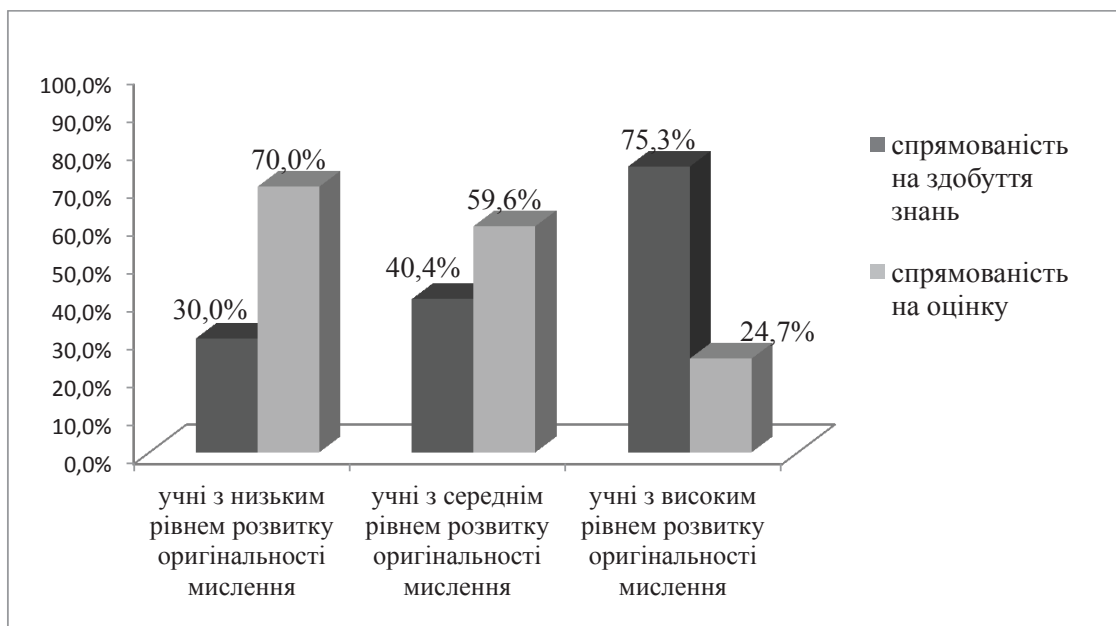
Рис. 2. Особливості навчальної мотивації підлітків із різним рівнем розвитку оригінальності мислення

З рис. 2 видно, що учні з низьким рівнем розвитку оригінальності мислення мають переважно домінування мотиву отримання оцінки (70,0%). На противагу в підлітків із високим рівнем розвитку оригінальності мислення переважає мотив засвоєння знань (75,3%). Се-