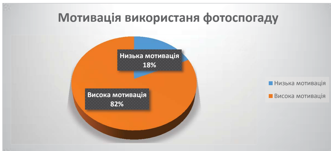
Рис. 2. Мотивація використання фотоспогаду

Отримані дослідження свідчать про відсутність стійких уявлень про можливість запровадження певного методу фотозображення в системі арт-супроводу клієнта. Використовувати ці методи можна як первинні на початкових стадіях консультаційної роботи, поступово розширюючи спектр завдань із використання фото в арт-терапії (див. рис. 3).