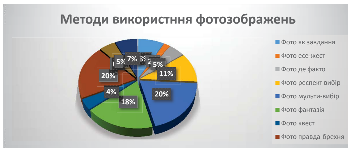
Рис. 3. Методи використання фотозображень

4. Вербалізація асоціативних потоків до карток і зображень. Вербалізація основних асоціативних наративів до зображення або їх з'єднання забезпечує більш якісний діалог у свідомості «Я». Провести діалог більш успішно можливо з використанням таких прийомів: – звернути увагу на концентрацію зосереджень на конкретному зображенні;