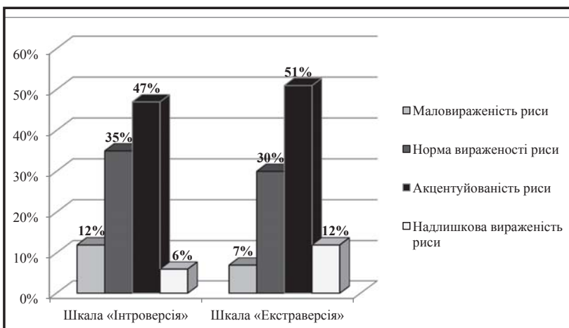
Рис. 2. Показники рівневого прояву полярних компонентів локалізації контролю особистості підлітків (n=300)