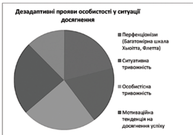
Рис. 1. Показники внеску предикторів у прогнозуванні динаміки дезадаптивних проявів особистості у ситуації досягнення

За результатами проведення корекційної програми виявлено позитивну динаміку зниження рівня деструктивних проявів перфекціонізму досліджуваних за показ-