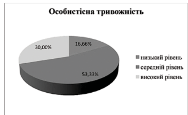
Рис. 2. Відсоткове співвідношення досліджуваних із різними рівнями особистісної тривожності

Проаналізовано також і особистісну тривожність досліджуваних (див. рис. 2).