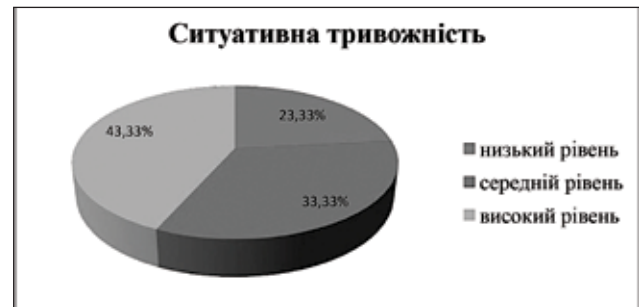
Рис. 1. Відсоткове співвідношення досліджуваних із різними рівнями ситуативної тривожності

Виходячи з отриманих даних, можна говорити про те, що серед обраної нами вибірки досліджуваних дітей з неповних сімей переважна більшість із них має високий рівень ситуативної тривожності (43%), вагому частку займають також досліджувані з середнім рівнем ситуативної тривожності (33%). Це свідчить про те, що для таких дітей характерною є реактивна тривога, тобто тривога як стан. Такі діти можуть сприймати наявну ситуацію як загрозливу та небезпечну.