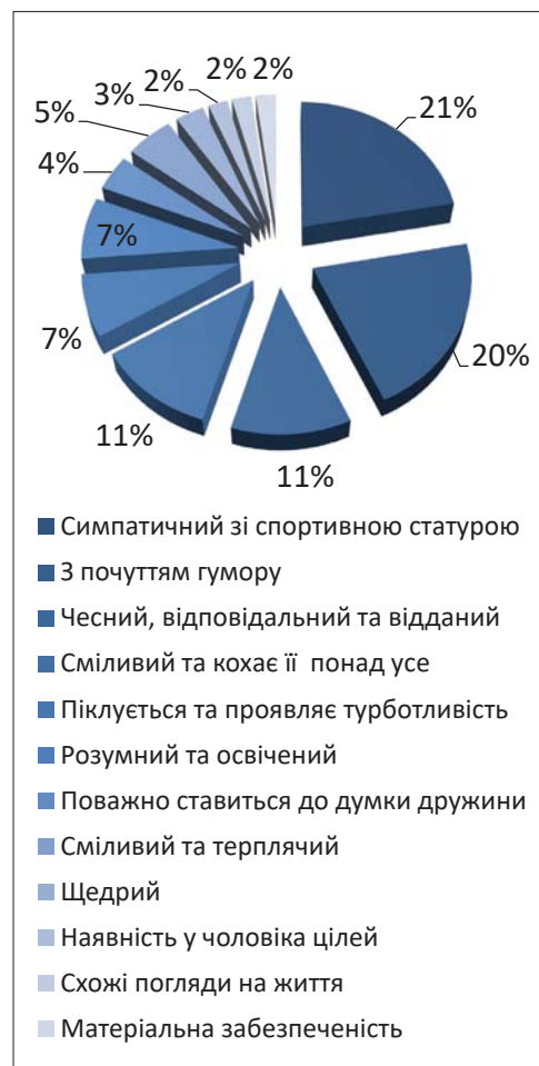
Рис. 2. Розподіл показників уявлень дівчат про риси майбутнього чоловіка

Неважливими для дівчат виявилися характеристики «наявність у чоловіка чітких цілей» (2%), «схожі погляди на життя» (2%) та «матеріальна забезпеченість» (2%). Те, що дівчата у своїх уявленнях на останнє місце поставили матеріальну забезпеченість, вказує на те, що у виборі партнера вони керуються власними почуттями, а не його грошовими статками. Однак вони все одно вважають, що матеріальне забезпечення родини – це головна функція їхнього майбутнього чоловіка.