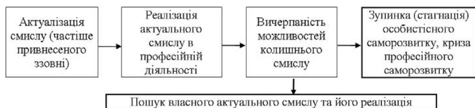
Рис. 2. Модель професійного саморозвитку особистості. Динаміка особистісних смислів професійної діяльності

Встановлюючи певні значущі взаємовідносини, особистісне ставлення, особистість впливає на внутрішню позицію, систему настанов, а отже, і на зміст та характер власного самовизначення. Особистість, яка є соціально зрілою та самовизначилася, можна охарактеризувати як суб'єкта, що усвідомлює свою мету, ідеал, особистісні властивості, можливості та здатний узгоджувати їх із зовнішніми соціальними вимогами, тобто свідомо організовує власний особистісний саморозвиток. Однак необхідно взяти до уваги, що соціальні відносини, міжособистісні взаємини і сама особистість постійно змінюються. Динамічний ритм життя потребує від особистості здатності змінюватися та постійно працювати над собою, знаходити сенс свого життя та професійної діяльності і способи їх реалізації, що також сприятиме уникненню професійного й особистісного вигорання. Ціннісно-смисловий аспект суб'єктної поведінки фахівця в контексті концепції саморозвитку пропонує модель професійного саморозвитку особистості [6] (рис. 2).