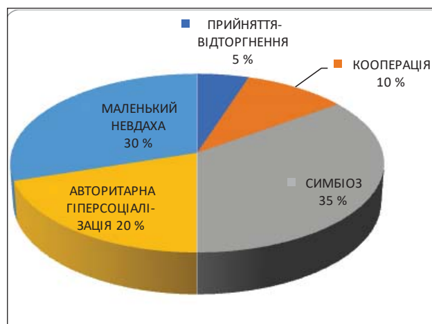
Рис. 1. Рівні вираження типів батьківського ставлення (у %)

Для наочності подамо ці дані також у вигляді рисунка (рис. 1.):