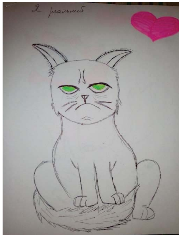
Рис. 2. «Я-реальне» І., 17 років