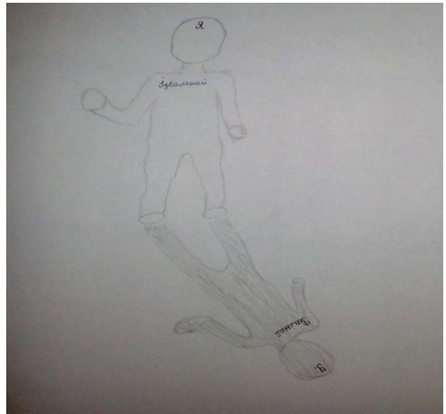
Рис. 3. «Я-реальне та Я-ідеальне» К., 18 років

Її ідеальне «Я» намальоване у вигляді білої та пухнастої кішки, усміхненої та щасливої. Голубка представляє такий аспект особистості дівчини, як миротворчість та прагнення уникати конфліктів. Цей малюнок розкриває потребу любити, піклуватися, а також отримувати підтримку від близьких людей. Ідеальний образ передбачає здатність дівчини до самозахисту та відстоювання себе, адже кішка, навіть біла та пухнаста, залишається хижою твариною.