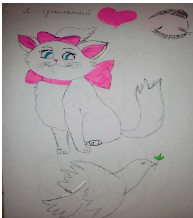
Рис. 1. «Я-ідеальне» І., 17 років

привабливості позитивно відображається майже на всіх аспектах самоставлення. Особливий інтерес до свого фізичного «Я» розглядався науковцями як притаманний підлітковому і юнацькому віку, коли відбувається особливо інтенсивне формування образу тіла [1; 3]. І хоча, на думку класиків вікової психології, з переходом до юнацького періоду хвороблива фіксація на зовнішності має бути замінена розвитком інших способів зміцнення самооцінки [1], ми бачимо, що значна кількість опитуваних