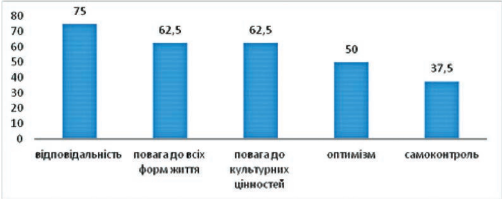
Рис. 2. Найвагоміші показники вихованості підлітків, на думку фахівців