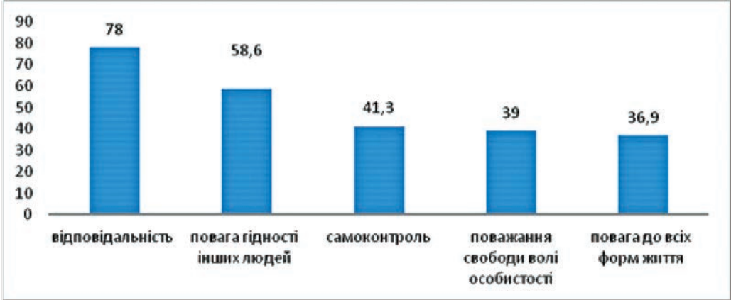
Рис. 1. Найвагоміші показники вихованості підлітків, на думку батьків

Під час опитування фахівців було отримано дещо інші результати, представлені на рис. 2. Зокрема, найвагомішим критерієм, на думку 75% опитаних, було вибрано також відповідальність підлітка. Але наступними