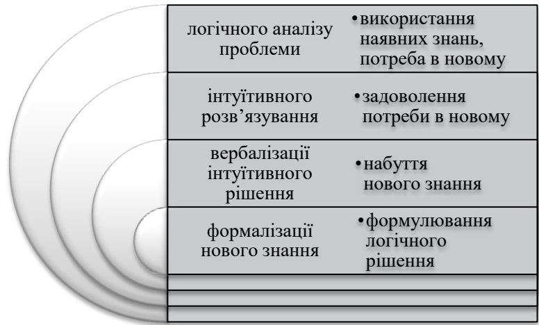
Рис. 2. Етапи реалізації механізмів творчої діяльності

Загалом у дослідженні творчої діяльності провідними є пізнавальна, емоційна